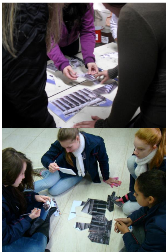
Figuras 1 e 2 - Realização de atividades do Arquetetando na área de História