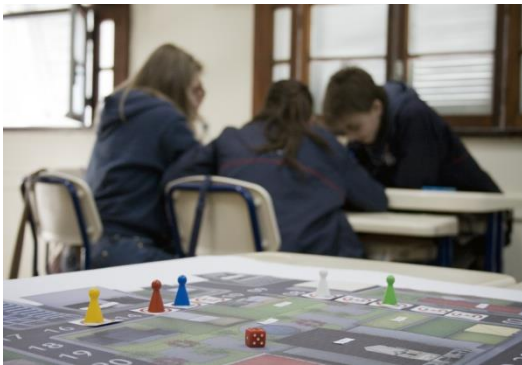
Figuras 5 e 6 – Imagem do tabuleiro e do grupo de alunos desenvolvendo as questões

cronometrado, somando pontos conforme os acertos do grupo (figura 5). As questões apresentam níveis de dificuldade classificados entre fácil, médio e difícil, sendo a pontuação proporcional a estes.